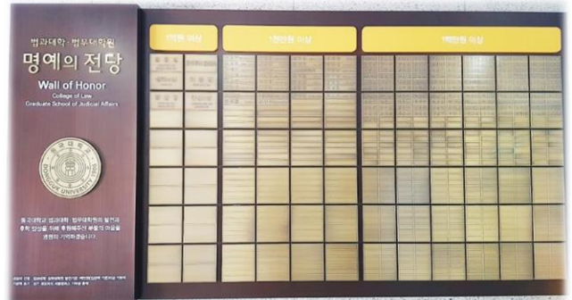
(상세명단은 첨부파일 참조)

이번 법과대학·법무대학원 명예의 전당은 법학관 1층 로비 벽면에 가로 3.1m 세로 1.6m 규모로 조성되었습니다. 이 명예의 전당은 우리 법과대학과 법무대학원의 발전과 후학 양성을 위해 후원해 주신 분들의 고귀한 뜻을 기리고 고마움을 기억하고자 마련했습니다.